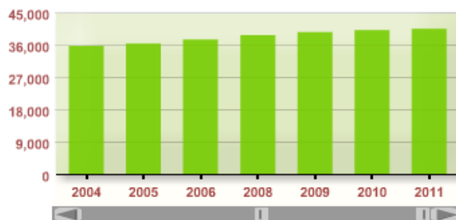
Padrón: Población Total (varones)